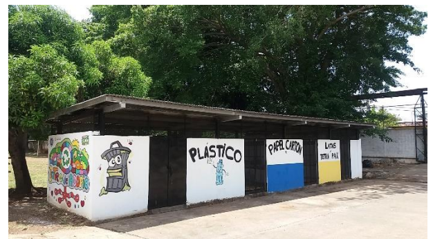
Punto Limpio Instituto Don Bosco