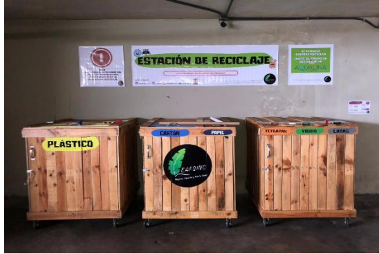
PH Aqualina - Punta Pacifica